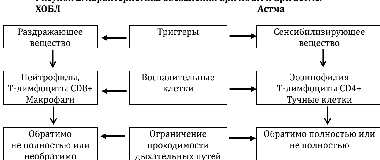
Рисунок 2. Характеристика воспаления при ХОБЛ и при астме.

Ведущие отправные пункты для дифференциальной диагностики этих болезней даны в табл. 6.