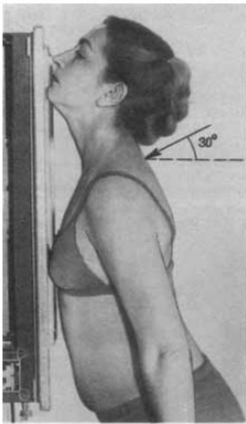
Рис. 514. Укладка для рентгенографии верхушек легких в прямой передней проекции.

Снимок легочных верхушек в задней проекции также выполняют в положении больного стоя или сидя. Больной прислоняется спиной к стойке, сильно опустив плечи и слегка наклонившись кпереди. Центральный пучок рентгеновского излучения направляют каудокраниально под углом 30^\circ в центр кассеты через верхушки легких (рис. 515).